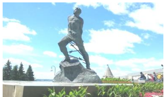
Казан, Муса Жәлил һәйкәле