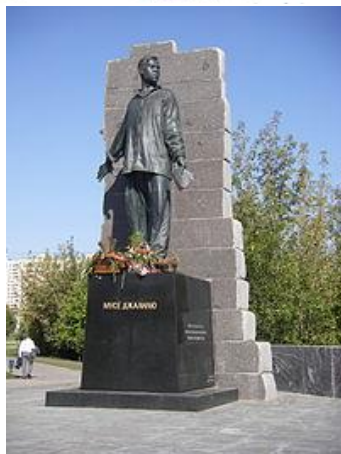
М.Жәлилгә багышланган һәйкәлләр