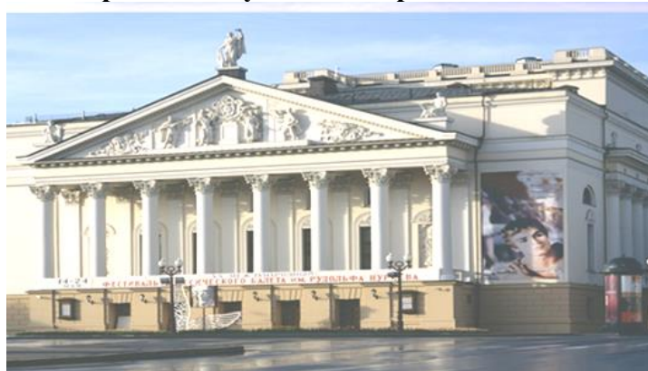
М. Жәлил исемдәге опера һәм балет театры